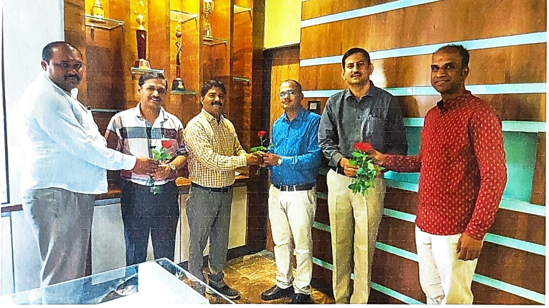
सेवा सप्ताह सन्मान